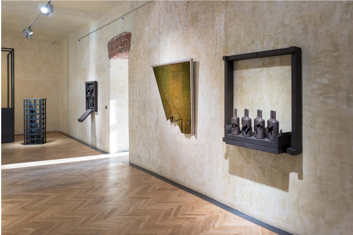
Morgenabendtot – pohled do instalace.