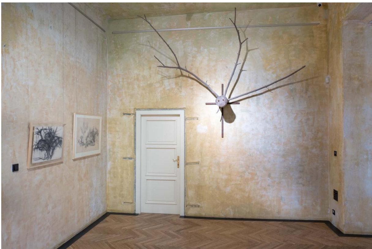
Kurt Gebauer – pohled do instalace.